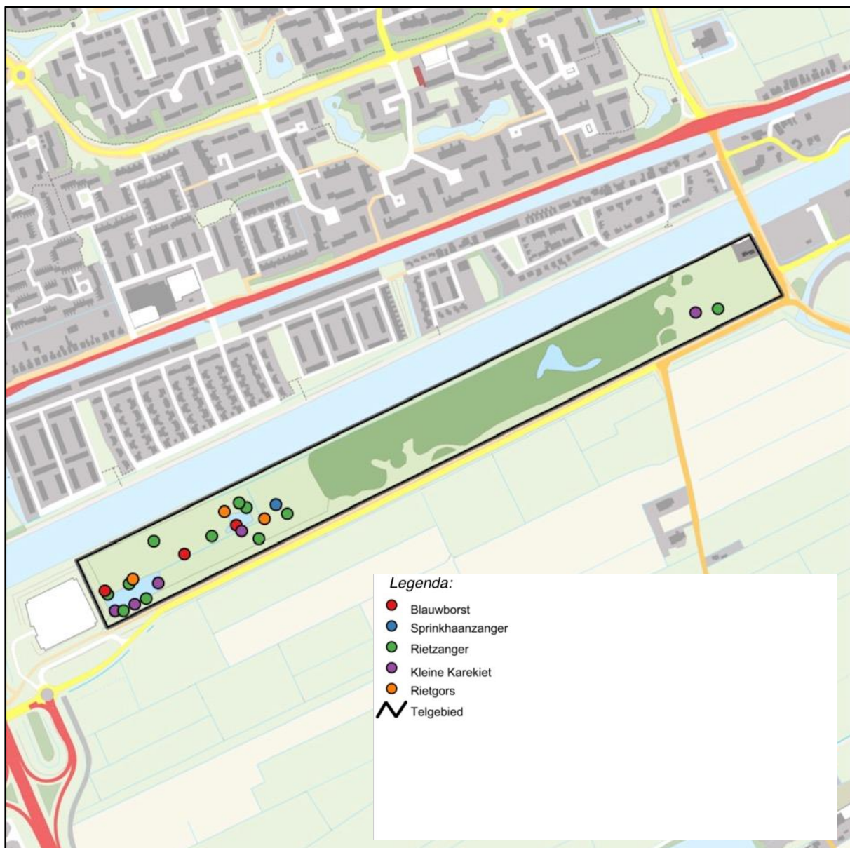
Figuur 5: Rietvogels

Figuur 5 geeft een overzicht van de territoria van de rietvogels. In totaal zijn 23 territoria vastgesteld, verdeeld over 5 soorten. Verreweg het grootste deel van de territoria (21) liggen in het open gedeelte in het westelijke deel van het onderzoeksgebied met een concentratie rond de lage, nattere delen. De koekoek maakt geen deel uit van deze ecologische groep, maar wordt het meest gezien en gehoord in de open terreindelen aan weerszijden van het opgaande bos. De aanwezige rietvogels (met name kleine karekiet) zijn vermoedelijk belangrijke gastouders voor de koekoek.