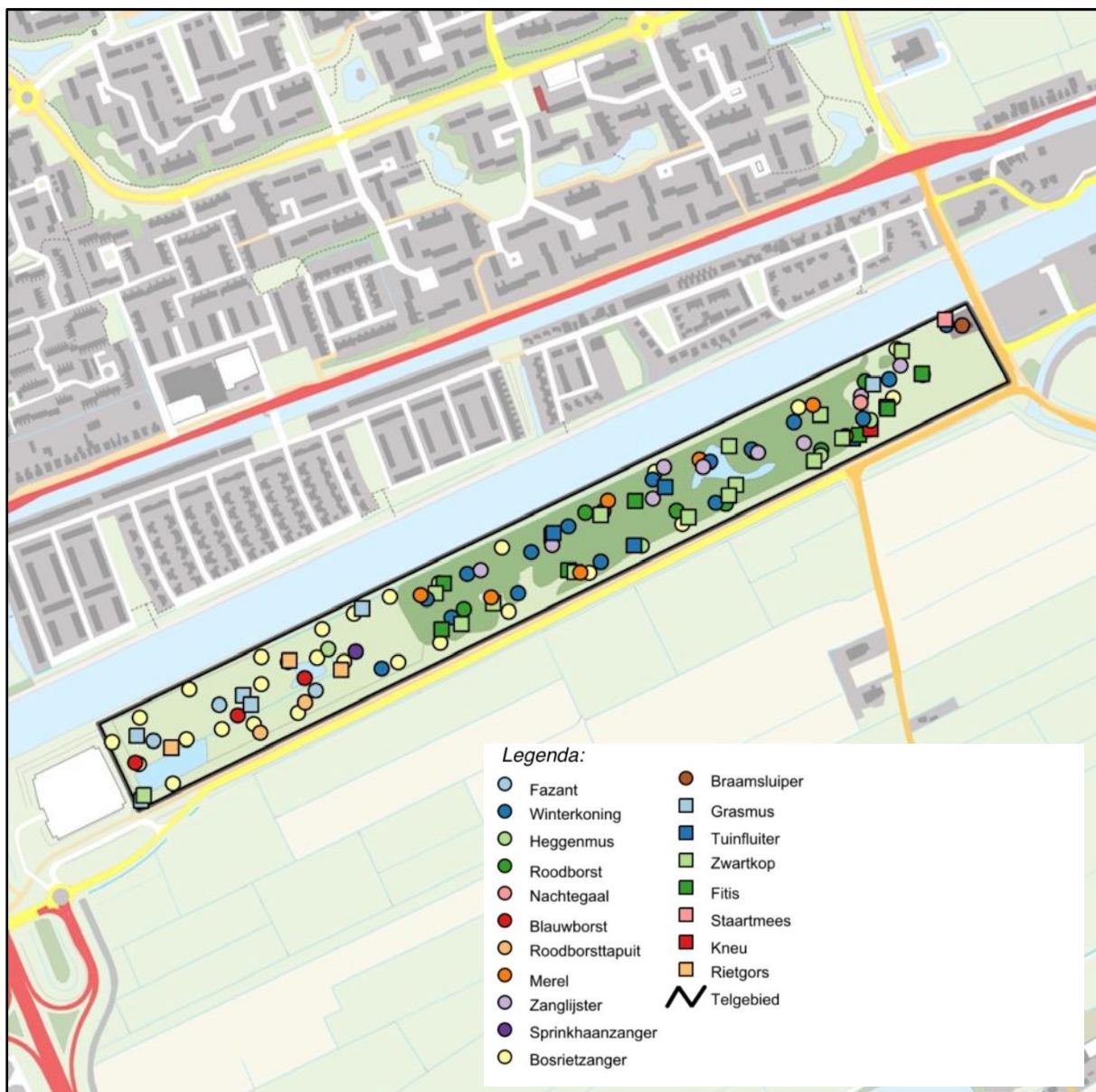
Figuur 6: Struweelvogels

Figuur 6 geeft een overzicht van de territoria van de struweelvogels. Met 122 territoria, verdeeld over 19 soorten, is dit met stip de best vertegenwoordigde ecologische groep. Overigens zit er enige overlap tussen de ecologische groepen. Opvallend is dat deze ecologische groep over het gehele onderzoeksgebied is verspreid, maar dat er qua soorten wel verschillen zitten tussen het beboste deel en de open delen. In het beboste deel zijn winterkoning, zwartkop, zanglijster, merel en fitis de meest talrijke soorten, in het open gedeelte zijn dat bosrietzanger en grasmus. Van de minder algemene soorten komen blauwborst, sprinkhaanzanger en roodborsttapuit voor in het open gedeelte en nachtegaal en kneu in het beboste gedeelte (maar wel op de overgang naar open terrein).