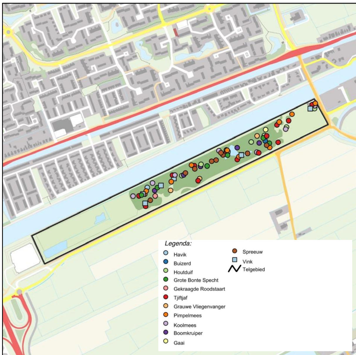
Figuur 7: Bosvogels

Figuur 7 geeft een overzicht van de territoria van de bosvogels. In totaal zijn 72 territoria vastgesteld, verdeeld over 13 soorten. De bosvogels zijn volledig beperkt tot het opgaande bos en het erf van beide woningen. Van de 13 soorten zijn er 7 holenbroeders, hetgeen wijst op voldoende beschikbaarheid van dikke en/of dode bomen met holten. Dit is ook voor vleermuizen een relevant gegeven. Er broeden zowel havik als buizerd in het bosgedeelte, deze roofvogels foerageren in de wijde omtrek, maar vinden in het Driebondsbos voldoende rust om te broeden. Minder algemene soorten zijn grauwe vliegenvanger en gekraagde roodstaart, elk met 3 territoria aanwezig.